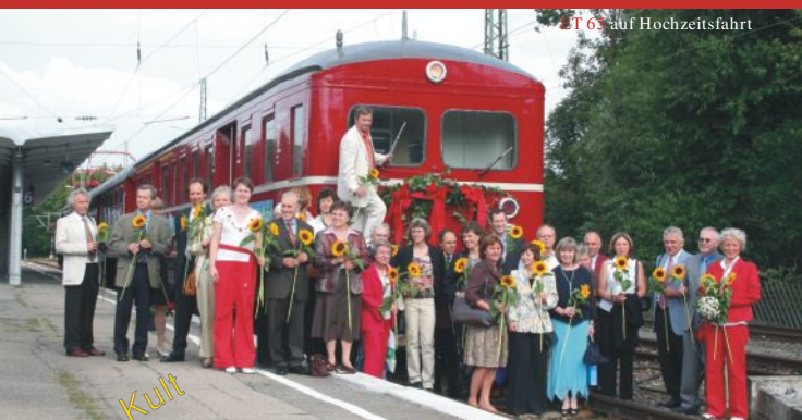
ET 65 auf Hochzeitsfahrt

Für reizvolle Fahrten auf Nebenstrecken empfehlen wir Ihnen eine Reise mit unserem historischen Schienenbus. Hier blicken Sie dem Lokführer während der Fahrt direkt über die Schulter und genießen einen atemberaubenden Rundumblick.